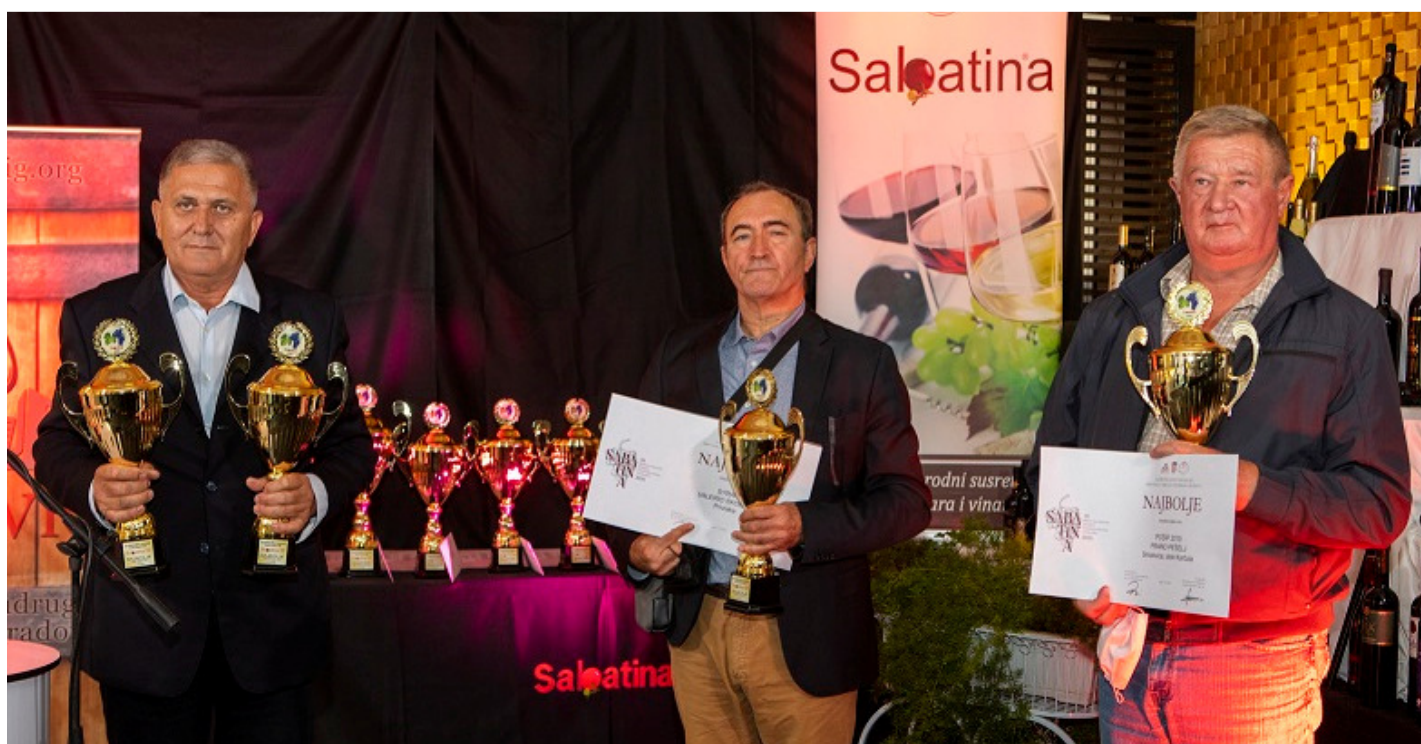
Proizvođači najboljih otvorenih i mladih vina na Sabatini 2020.