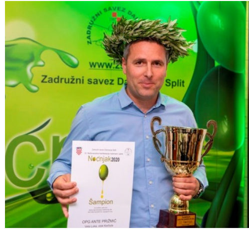
Šampion kvalitete pakovina maslinovog ulja