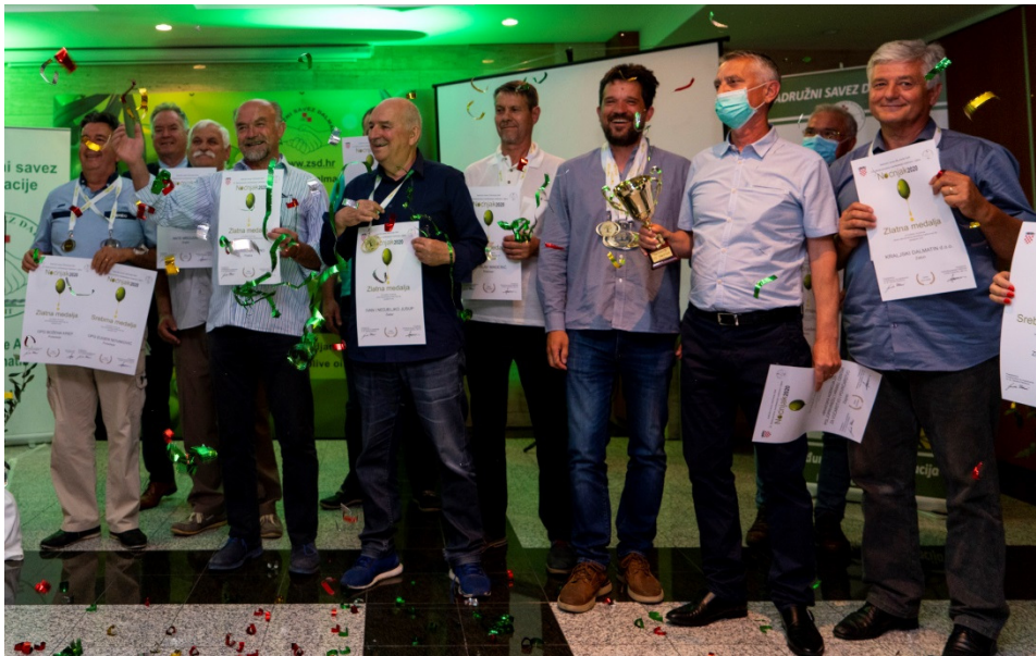
Zlatni maslinari u kategoriji otvorenih maslinovih ulja