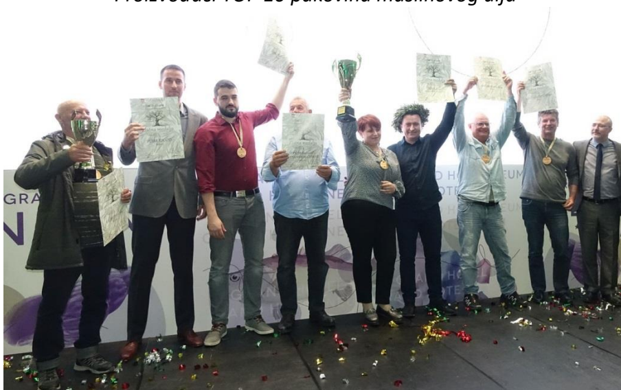
Proizvođači TOP 10 otvorenih maslinovih ulja