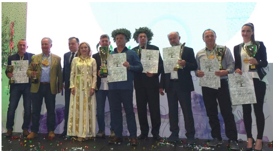
Proizvođači TOP 10 pakovina maslinovog ulja