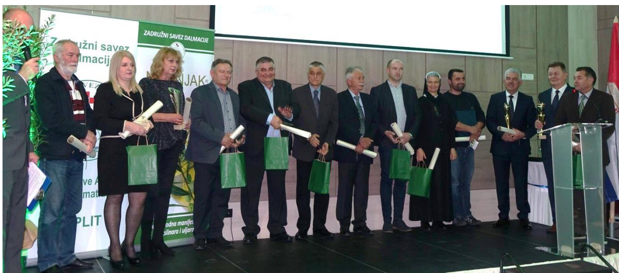
Laureati Noćnjaka 2019. - Dobitnici osobnih i kolektivnih priznanja

Vrijeme nakon svečanog otvaranja sudionici su iskoristili za obilazak sajma maslinarstva i uljarstva, Olio bara, te izložbe maslinovih ulja i proizvoda s oznakom „Hrvatski otočni proizvod“, u okviru kojih su predstavljeni proizvodi četiristotinjak proizvođača te tvrtki koje asortimanom prate proizvodnju maslinovog ulja.