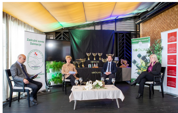
Emisija s moderatorima o znanstveno-stručnim temama