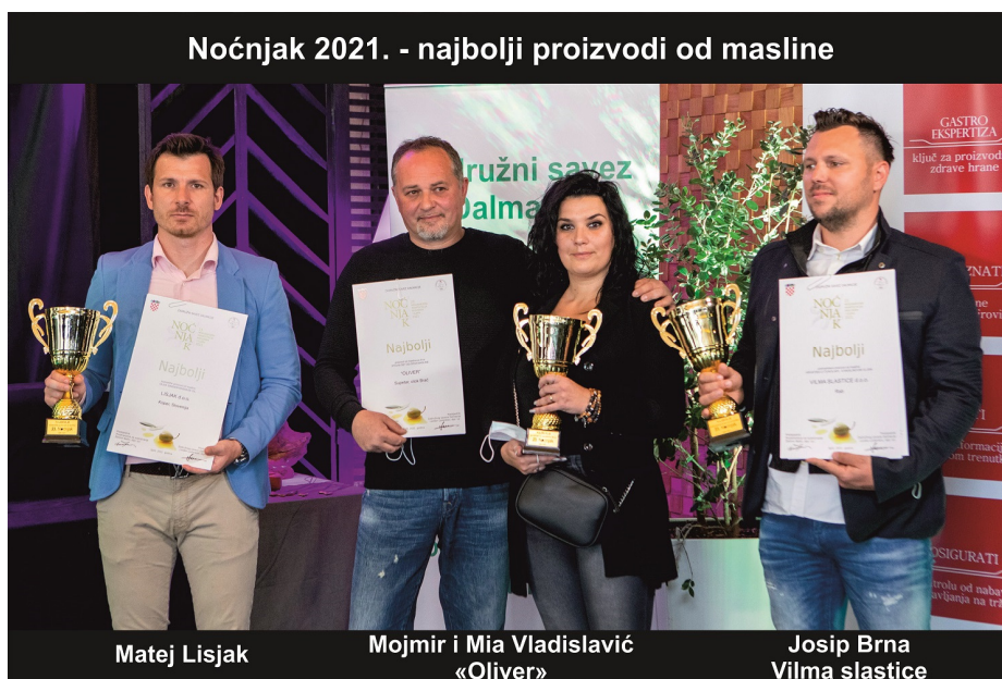
Proizvođači najboljih proizvoda od masline