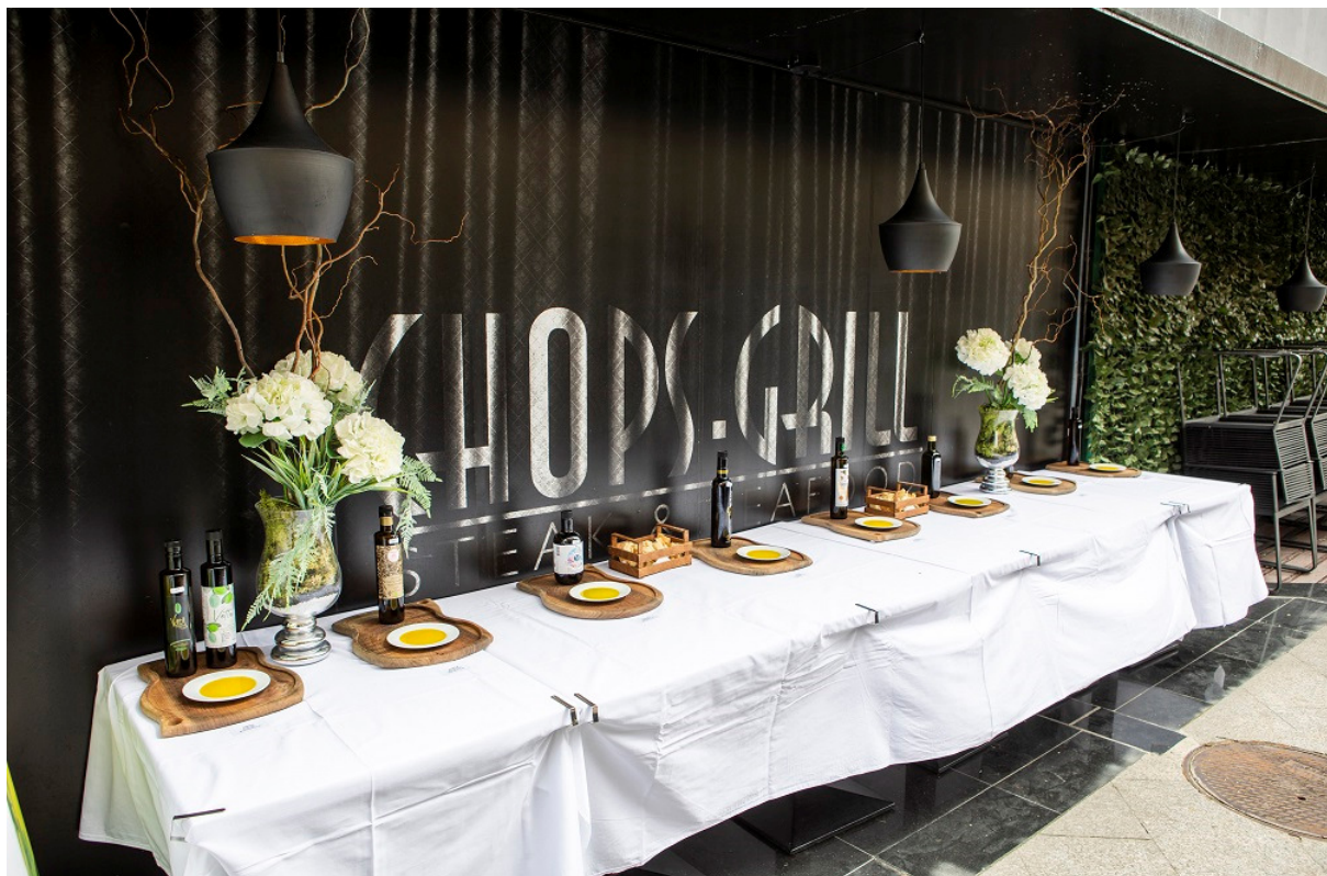
Olio bar - degustiranje najbolje ocijenjenih maslinovih ulja

Ispred studija Noćnjaka na otvorenom prostoru, uz služenje vedrog i sunčanog vremena, postavljena je izložba pakovina maslinovih ulja i proizvoda od masline dostavljenih na ocjenjivanje i natjecanje, ispred koje su mediji uzimali izjave nagrađenih maslinara i uljara. Na Olio baru sudionici i prolaznici mogli su kušati najbolje ocijenjena maslinova ulja.