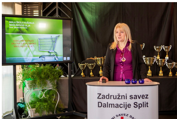
Mala škola maslinovih ulja

Tako je u 10 h snimljena je radionica „Mala škola maslinovih ulja“ na temu „Kako prepoznati ekstra djevičansko maslinovo ulje?“. Raionicom je moderirala dr. sc. Sandra Petričević, predsjednica profesionalnog panela Zadružnog saveza Dalmacije. Nakon toga u 11 h snimljeni su materijali za prikazivanje emisije o znanstveno-stručnim temama iz maslinarstva i uljarstva uz prisutnost dugogodišnjih moderatora stručnih skupova na Noćnjaku.